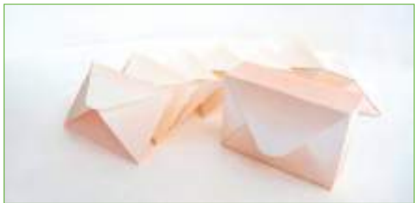
「こたより」(レターセットのパッケージデザイン/オーディション作品)