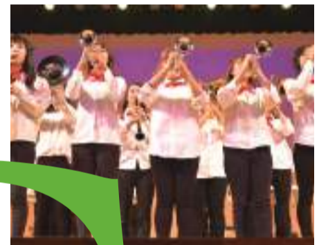
表 現学習の成果発表の場として毎年開催しています。40 回目となる今回は「親子で楽しむKinjo Waku Waku World」と題して、子どもたちの大好きな歌やおはなし、遊びを取り入れ、親子で楽しんでもらえるように企画しました。2年生が総出演し、歌やダンス、着ぐるみ劇、英語ミュージカル、マーチングなど披露しました。会場の金沢市文化ホールにはたくさんのお客さんが来場し、温かい声援や拍手を送ってくれました。