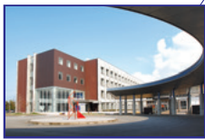
金城大学 [笠間キャンパス]