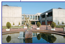
金城大学短期大学部 [笠間キャンパス]