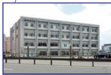
金城大学 [松任キャンパス]